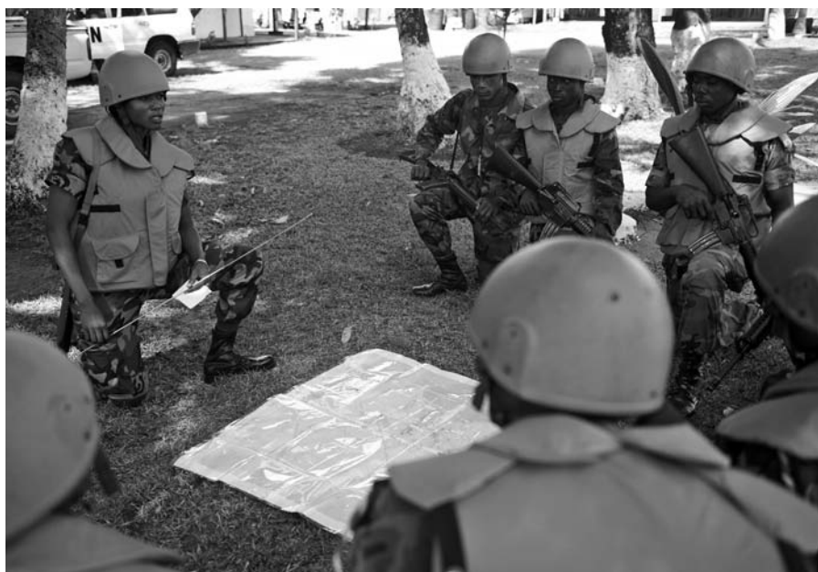
▲ Efectivos militares de mantenimiento de la paz ghaneses en Buchanan, Liberia. Abril de 2009.

evaluación técnica. Este enfoque asegurará que los asuntos de género influyan en los planes militares estratégicos y continúen informando sobre la planificación e implementación futura durante toda la misión de mantenimiento de la paz, a nivel operacional y táctico.